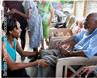
Barbados Physical Therapy Association