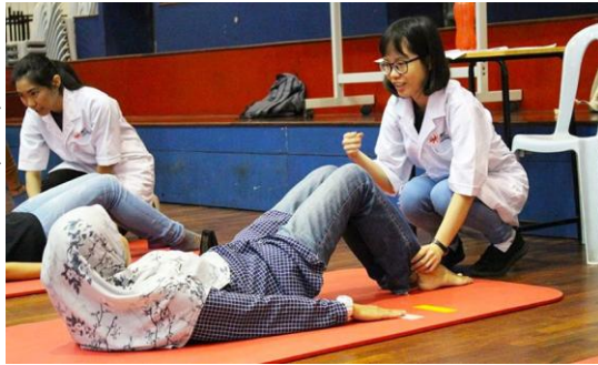
INTI International University | Malaysia

Vježba je dokazana terapija za osobe s depresijom, a fizioterapeuti rade s osobama koje boluju od depresije uz dugotrajne zdravstvene probleme. Biti aktivan i ostati u formi pomoći će vam da poboljšate tjelesno i mentalno zdravlje. Razgovarajte s fizioterapeutom i otkrijte vježbu ili aktivnost u kojoj ćete uživati i ujedno se zabaviti!