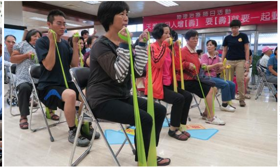
Taiwan Physical Therapy Association

Budi aktivan. Ostani aktivan. Već danas razgovaraj s fizioterapeutom.