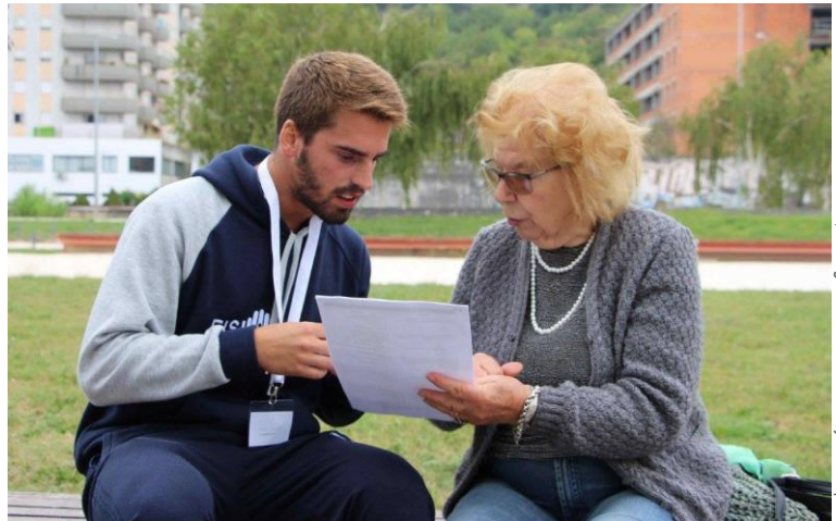
ESTeC Coimbra Health School | Portuguese Association of Physiotherapists

Vježba je dokazana terapija za osobe s depresijom, a fizioterapeuti rade s osobama koje boluju od depresije uz dugotrajne zdravstvene probleme. Biti aktivan i ostati u formi pomoći će vam da poboljšate tjelesno i mentalno zdravlje. Razgovarajte s fizioterapeutom i otkrijte vježbu ili aktivnost u kojoj ćete uživati i zabaviti se!